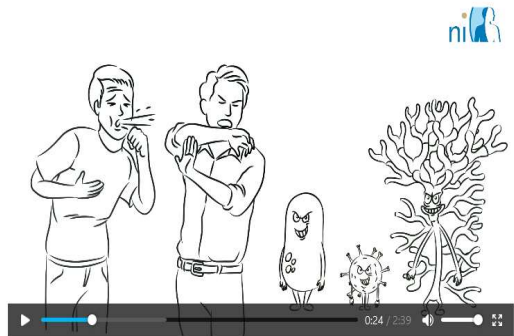
Schulungsfilm 'Infektionen vermeiden'