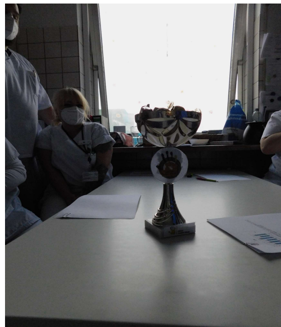
Die Übergabe des Pokals 😊